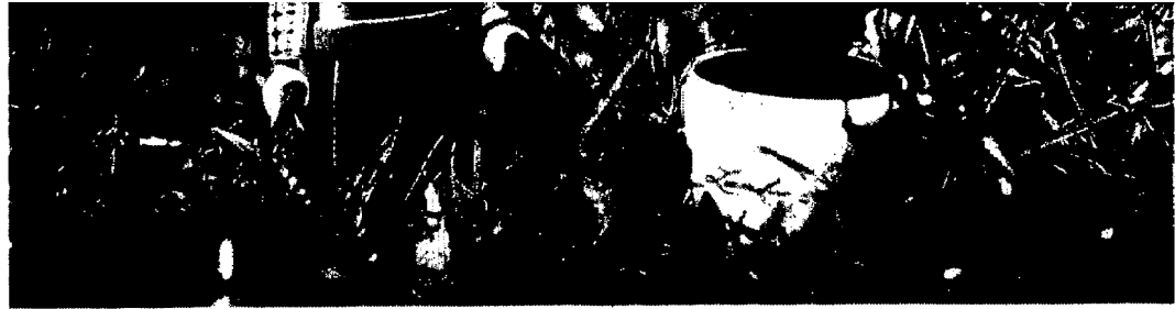
Gärtner, Straßenfeger – oder vielleicht doch ein ganz anderer Job? Die Möglichkeiten in der Berufswelt sind umfangreich, da ist guter Rat wichtig

War bis 1998 Berufsberatung ausschließlich eine Domäne der