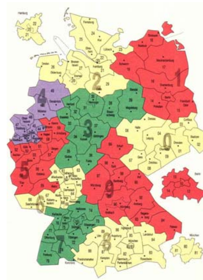
Tab. 2: Geographische Verteilung der Stichprobe nach Postleitzahlengebiet