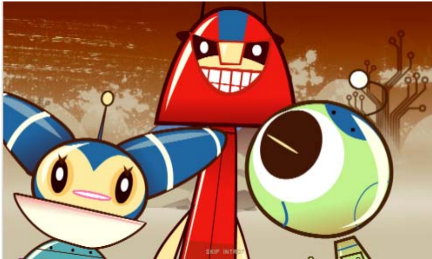
Abbildung 1: Die Roboter bit, byte und nibble

Im Projekt iLearnIT.ch wird die vom MIT entwickelte, auf Smalltalk / Squeak aufbauende, für verschiedene Betriebssysteme frei verfügbare Programmierumgebung Scratch [MBK04] verwendet. Sie ermöglicht das einfache Erstellen von Programmen durch Zusammenfügen von vorgegebenen Programmelementen. Damit wird der Fokus auf die Konzepte und nicht die Sprachgrammatik gelegt. Im Vergleich zu älteren Programmierumgebungen für Bildungszwecke zeichnet sich Scratch durch grosse Multimedialität aus. Das Einbinden eigener Bilder und Töne erhöht die Attraktivität der Sprache für Kinder und Jugendliche und ermöglicht einen nicht-formalen Einstieg ins Programmieren, z.B. mittels story-telling, was unter Umständen das Interesse von Mädchen wecken kann [KP07]. Die Programmierumgebung Scratch eignet sich auch sehr gut für entdeckendes Lernen, passt also auch diesbezüglich zu den Prinzipien von iLearnIT.ch.