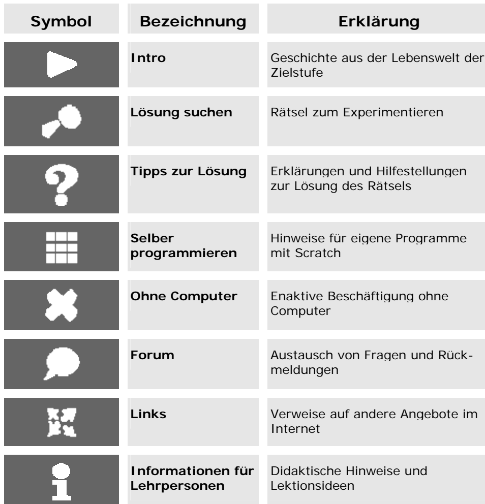
Tabelle 2: Elemente der einzelnen Lerneinheiten von iLearnIT.ch

Der zu Beginn des Projektes betriebene, relative grosse Aufwand zur Definition dieser Struktur sollte sich mit der Entwicklung weiterer Module wieder auszahlen, da nun vordefinierte „Gefässe“ gefüllt werden können. Dies wird besonders relevant, wenn Module durch externe Partner entwickelt werden sollen (s. u.).