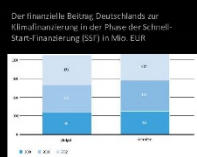
Quelle: BMU, First start finance - Review and lessons learnt, Fallstudie, Berlin 2013.

Auf dem Weg zu einem neuen Klimaabkommen bis 2015