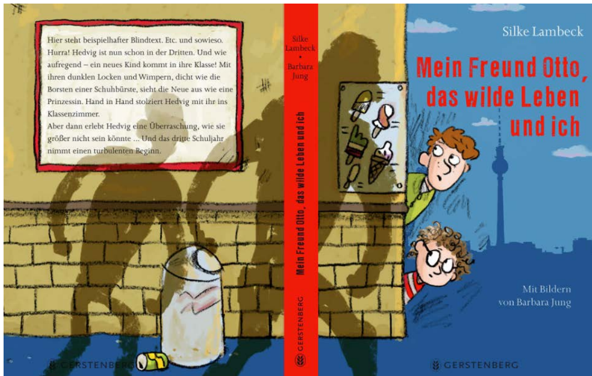
Titelgestaltung von Barbara Jung zu Mein Freund Otto, das wilde Leben und ich von Silke Lambeck © Gerstenberg (Entwurf mit Platzhalter für den Klappentext von der Website Barbara Jung)