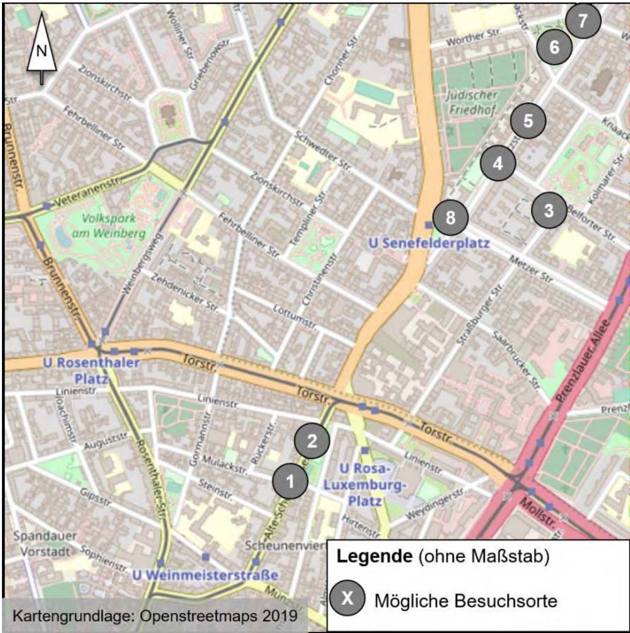
Mögliche Besuchsorte in Mitte/Prenzlauer Berg