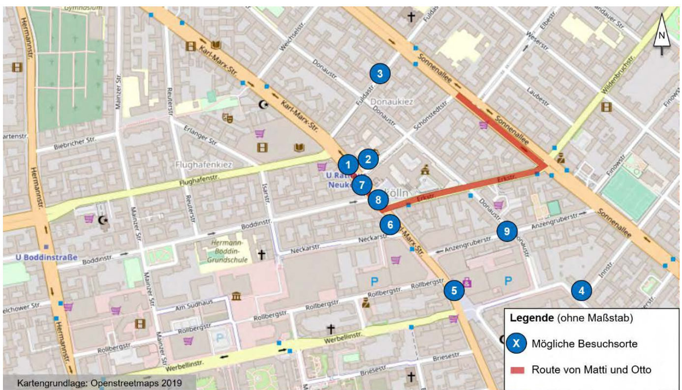
Mögliche Besuchsorte in Neukölln

Technische Voraussetzungen und Material: Kamera/Tablet/Smartphone für die SuS, gegebenenfalls Fahrtwegbeschreibung A 3, Plakatbögen