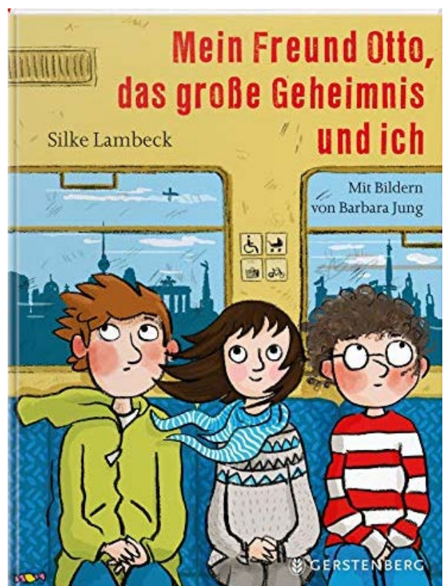
Titelbilder © Gerstenberg 2018 und 2019