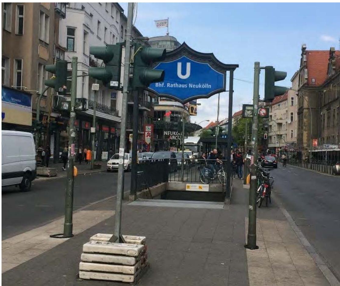
U-Bahnhof Rathaus Neukölln.

Beschreibung des Verlaufs: Die SuS vergleichen die Illustration des Bahnhofs mit einem Foto des Originalschauplatzes. Anschließend gestalten sie eine alternative Darstellung des gleichen Motivs. Sie werden dazu angeregt, auch stilistisch anders zu arbeiten als Barbara Jung und – im Rahmen der vorhandenen Möglichkeiten – auch eine freie Entscheidung über die Wahl der Technik zu treffen. Ein expressives Arbeiten mit Wasserfarben wäre also ebenso möglich, wie das präzise Abzeichnen der Vorlage mit Bleistift, Filzstift oder Tusche, Verfremdungen des Fotos am Bildschirm, Collagetechniken etc.