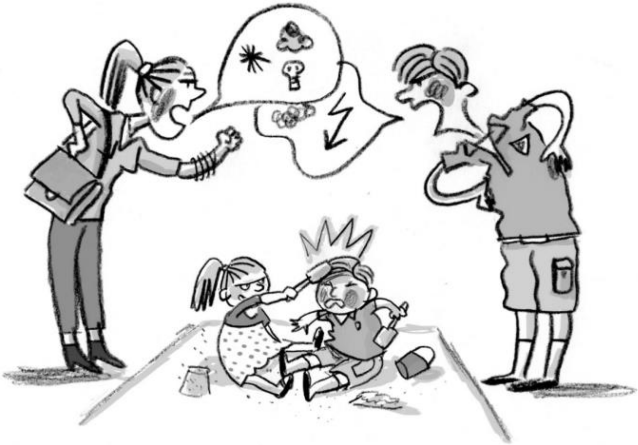
Streit zwischen Eltern auf dem Spielplatz. Illustration von Barbara Jung in: Mein Freund Otto, das wilde Leben und ich von Silke Lambeck © Gerstenberg, S. 27

Die Illustrationen haben keine konstitutive Funktion, sie sind zum Verständnis des Inhalts nicht unbedingt notwendig. Einige davon visualisieren Konflikt-, Wende- oder Höhepunkte (Otto, S. 146) der Handlung, andere vermitteln vor allem konkrete Vorstellungen von Figuren, Orten und deren Atmosphäre (Otto, S. 99). Somit zählen sie zu den punktuellen Illustrationen, da sie einen Moment aus dem Fluss der Erzählung herausgreifen (vgl. Ries 1991, S. 12). Bisweilen wird im Text Ungesagtes illustriert oder die Illustrationen nehmen bildhafte Wendungen des Textes wörtlich. Beides zusammen ist bei der Darstellung der beiden Männer der Immobilienfirma mit Haiköpfen geschehen, denn der Begriff des ‚Immobilienhais/Miethais‘ kommt im Verbaltext gar nicht vor. Auch Mattis Aussehen wird im Text nicht beschrieben, jedoch in den Illustrationen visualisiert. Mit solchen Hinzufügungen hat die Illustratorin die Erzählung also auch interpretiert.